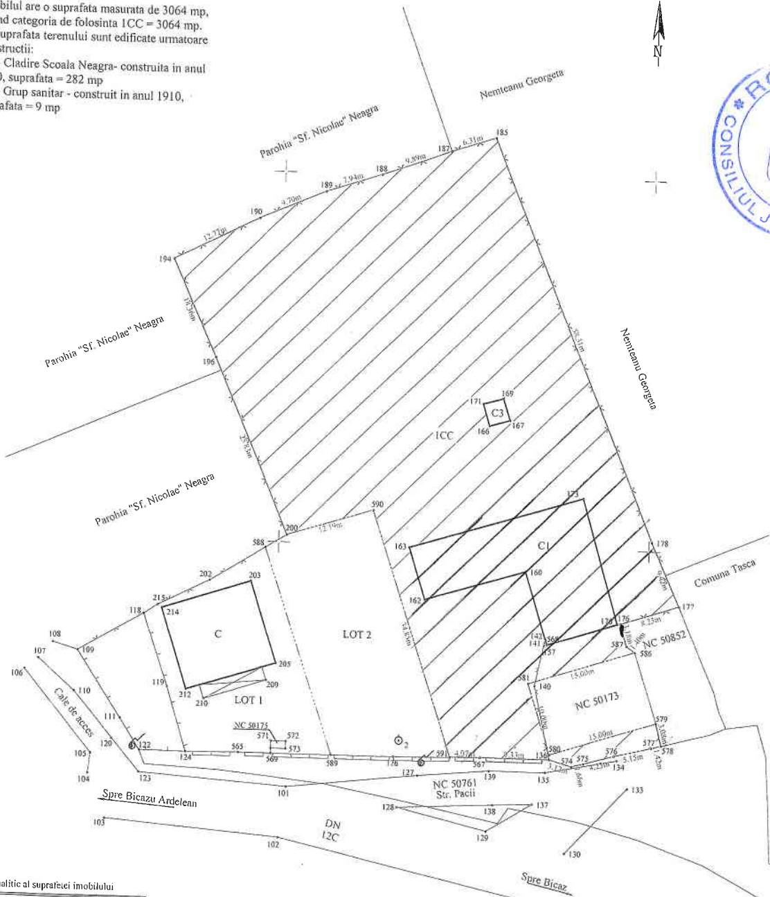
Calculul analitic al suprafetei imobilului