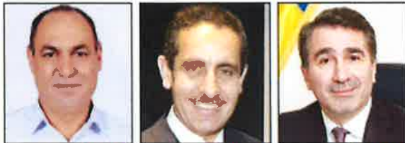
• ليونيل أرسين • طارق رحمي • د. شوقي سعيد

يُزور جمهورية مصر العربية حاليا وقد كبير من رجال الأعمال الرومانيين برئاسة السيد / ليونيل أرسين محافظه مقاطعة نيامنس بـرومانيا في زيارة رسمية بدأت يوم ١٩ سبتمبر الحالي وتستمر حتى يوم السبت القادم بهدف تطوير وصقل الشراكة مع جمهورية مصر العربية من جانب رومانيا.