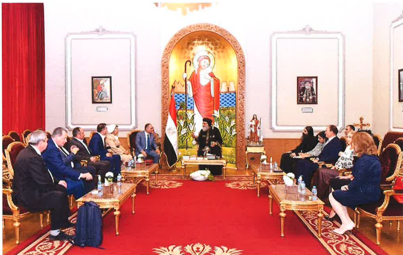
Primirea delegației Consiliului Județean Neamț de către Sanctitatea Sa Patriarhul Bisericii Ortodoxe Copte, Papa Tawadros al II-lea