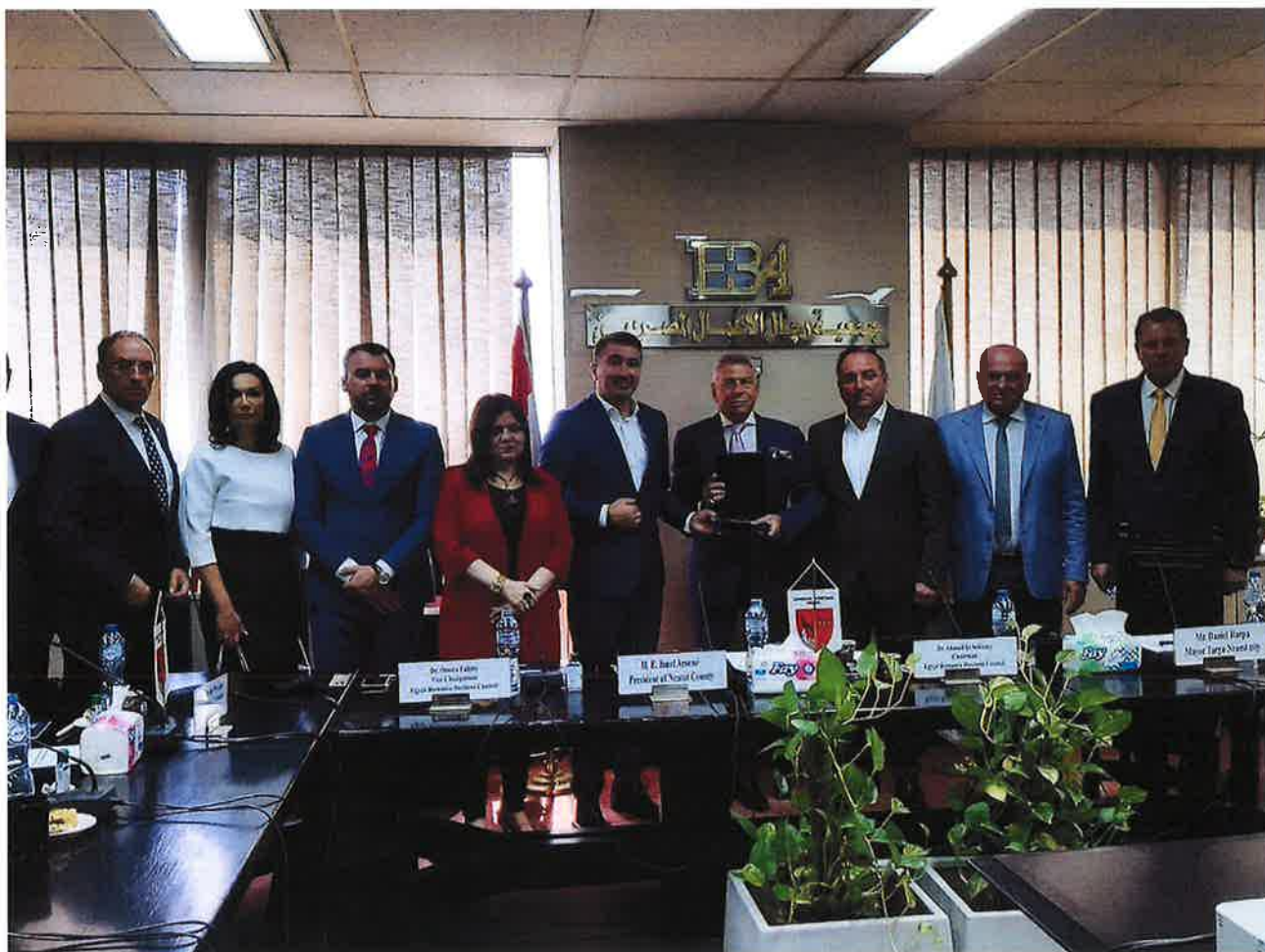
Întâlnirea dintre reprezentanții mediului de afaceri, la Egyptian Businessmen's Association