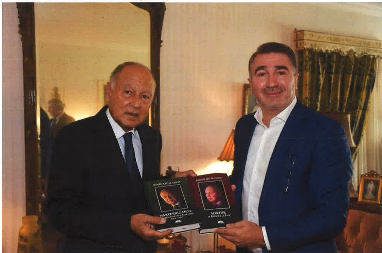
Primirea de către Secretarul General al Ligii Statelor Arabe, Excelența Sa, domnul Ahmed Abu Al Gheit