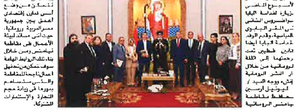
مجلس إدارة المعهد / ليويل أرسين محافظ مقاطعة نهايتن رومانيا بلق هذه الزيارة لجمهور مصر العريضة لهدف إلى تطوير العلاقات التجارية والاقتصادية والتعاون بين الدولتين.

في إطار الزيارة التي قام بها الوفد الروماني برئاسة السيد / ليويل أرسين محافظ مقاطعة نهايتن رومانيا السيد / أحمد أبو الغيط - الأمين العام لجامسة الدول العربية تم خالتهما بحث وجه التعاون بين الجانبين العربيين بهدف لقاء ومعرض مسافة خاصة، كما قامت مؤسسة «إيش رومانيا» بترجمة كتابي العرب والمسلمين وتوافق على النشر، السيد / أحمد أبو الغيط إلى القاتين الرومانية والروسية والتي تتناول فيها طامس ماهدة من حرب أكتوبر المجيد، كذلك قصة مباحثات السلام بين مصر وإسرائيل برعاية الولايات المتحدة الأمريكية في كتاب جديد والتي تم فيها وهي إنشاء السلام بين مصر وإسرائيل بشطفة ما تم الاتفاق عليها على عريضة ترقية الأراضى الروبية المصادرة، وما حدث بعد هذه الاتفاقية من جهود لبناء الدولة في حمر وأكل هذا السلام على التنبؤ. وقد قدم السيد / ليويل أرسين محافظ مقاطعة نهايتن بتقديم أول كتيب لكتابه المترجمين للغة الرومانية الروسية بصحبة السيد / الكرنز سلفندو ترجمة الكتابين. كما قام محافظ مقاطعة نهايتن الرومانية بترجمة الدعوة للسيد / محمد أبو الغيط لزيارة رومانيا خلال فترة الزيارة القادمة وإقامة محاضرة في مقر البرلمان الروماني وكذلك تنظيم حفل تيمم في المقام الرومانية بوزارة، تدشين الكتابين. حضر اللقاء د. شوقي سعيد نائب رئيس حزب الويادة للمصري. وكان الوفد الروماني قد ضم أيضا خلال زيارته لعدد من الأسيوطيين الذين شاركوا في الزيارة لندة أسيوط.