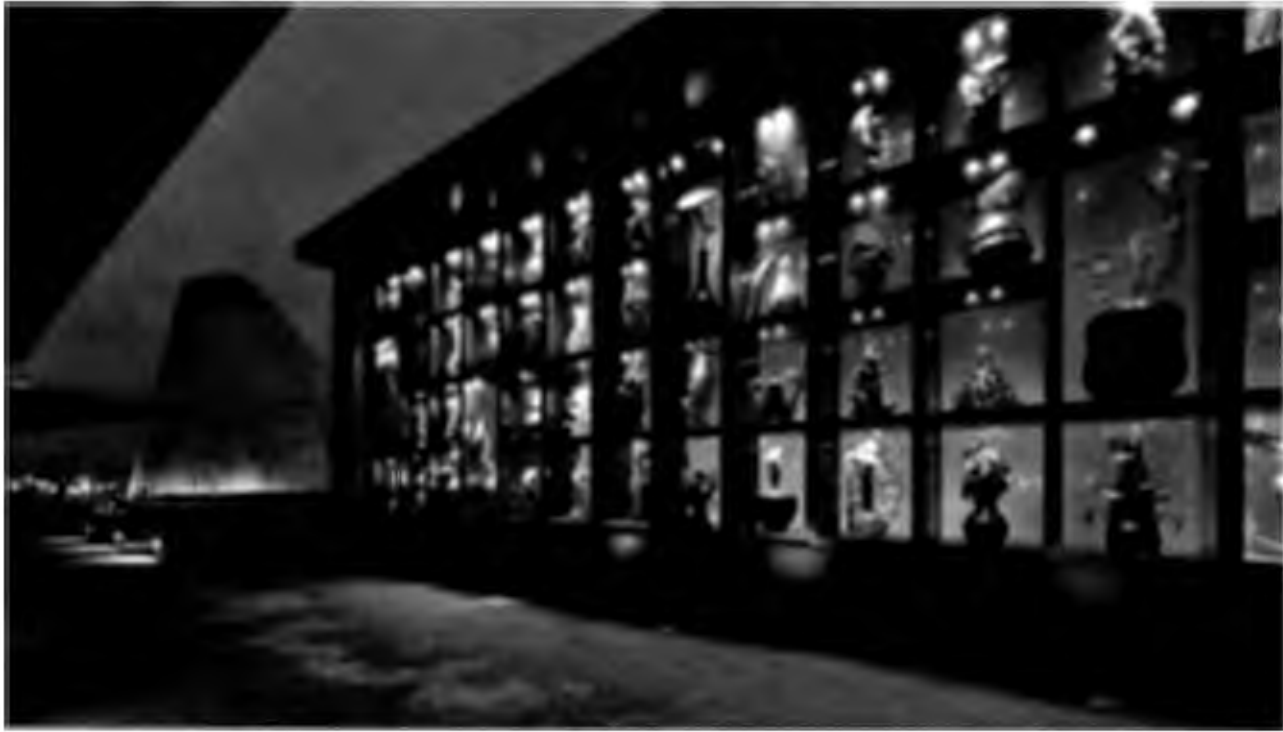
c) Inițiere și atracție pentru copii